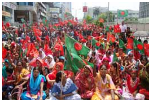
Klädarbetare i Bangladesh på 1:a maj 2011 i demonstration för levnadslön

De senaste åren har priset på bomull höjts 16 . Det är, precis som lönefrågan, en parameter som kan påverka företagets relation med leverantörer. En annan trend är att vi har sett arbetarprotester i flera asiatiska länder. Förra årets besked om lägre än förväntad höjning av minimilönen i Bangladesh till 3 000 Taka 17 ledde till massdemonstrationer. Flera fabriker stängdes och hundratals arbetare och arbetsrättsaktivister arresterades. I Kambodja deltog tusentals arbetare i en nationell strejk som krävde att minimilönen skulle höjas till 93 USD 18 i månaden. Hundratals arbetare är fortfarande avstängda från sina arbeten som ett resultat av detta. 19