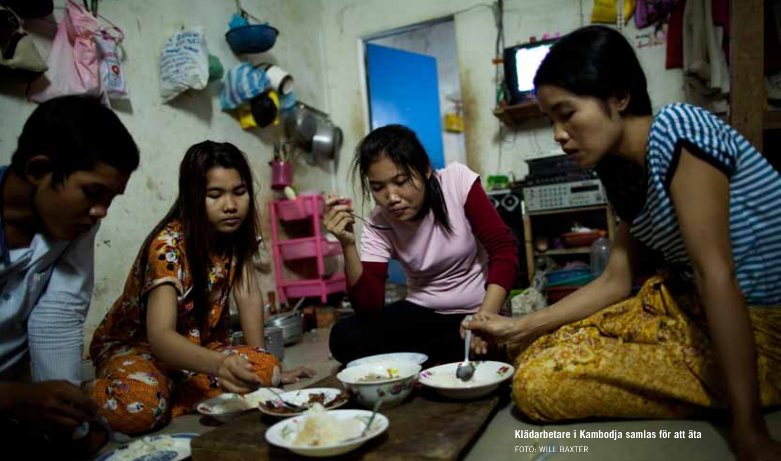
Klädarbetare i Kambodja samlas för att äta

lands högsta lagstadgade arbetsvecka men inte högre än 48 timmar och ett dagligt matintag på 3000 kalorier 27 . Under våren 2011 presenterade Asia Floor Wage Campaign reviderade siffror för levnadslö- nenivåer för de länder som är inkluderade i kampanjen. Siffrorna är baserade på de från 2009, men har nu justerats för inflation med hjälp av konsumentprisindex. 28 Enligt beräkningar på lönesiffror från 2011 utgör en minimilön i snitt cirka 44% av en lägsta levnadslön i sex länder med stor textilproduk- tion. Av dessa utgjorde minimilönen inte ens 25% av en lägsta levnadslön i Bangladesh medan mot- svarande siffra för Kambodja är cirka 37%. 29 Detta kan ställas mot att arbetarnas lönekostnader brukar utgöra ca 0,5%–3% av de totala produktionskostnaderna för ett klädesplagg. 30