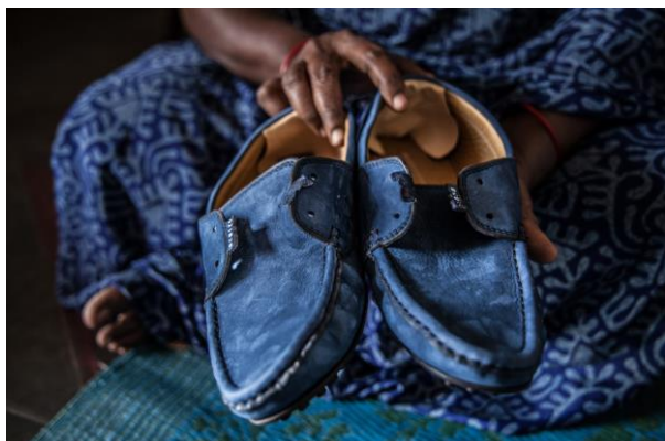
Foto från kampanjen på Göteborgs stads instagramkonto Greenhack. Den indiska kvinnan på bilden jobbar hemifrån med att tillverka skor.

I samband med besöket från Cividep blev vi inbjudna att ansvara för Greenhacks instagramkonto under en vecka. Kontot drivs av Göteborgs stad för att främja en mer hållbar livsstil och har drygt 4000 följare. Greenhack var en bra möjlighet att nå ut till vår målgrupp av medvetna konsumenter. Det mest spridda inlägget på Greenhack visades 2500 gånger och enligt Greenhack var inlägget det bästa på de senaste 30 dagarna.