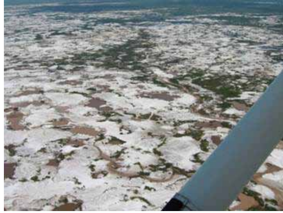
Till vänster: förbränning av kvicksilver utan skyddsutrustning. Till höger: ödelagd mark på grund av småskalig guldutvinning i Indonesien.

sprids i luften och andas in av arbetarna. Utsläppen genom avfallsvattnet sprids i naturen och i samhällen runt omkring. Kviksilver är mycket giftigt och kan bland annat orsaka neurologiska skador. Framför allt foster och barn är känsliga för ämnet. Höga halter har uppmätts hos befolkningen kring guldgruvor. Enligt en studie av barn till småskaliga gruvarbetare i Peru hade 85 procent av barnen farligt höga nivåer av kvicksilver i blodet. 21